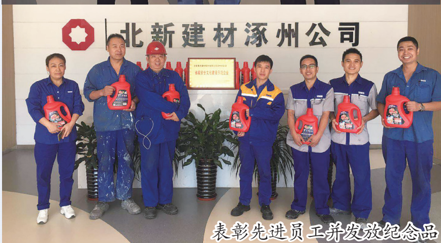
表彰先进员工并发放纪念品